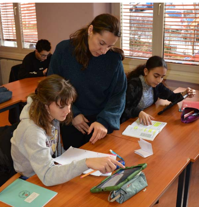
À gauche. La tablette fait désormais partie du paysage pendant les études dirigées.